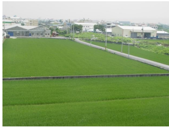
嘉犁農地重劃現況

於 73 年度辦理的嘉犁農地重劃區，重劃總面積 1077 公頃，範圍涵蓋和美鎮、鹿港鎮、彰化市等 3 鄉鎮，相較於其他重劃區，本重劃區最特殊的是，從開辦到完成一直在與時間賽跑。